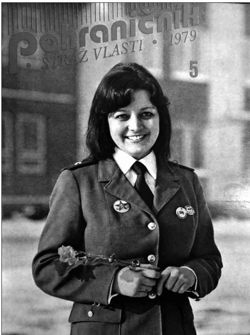
Titulní strana časopisu Pohraničník - Stráž vlasti z roku 1979