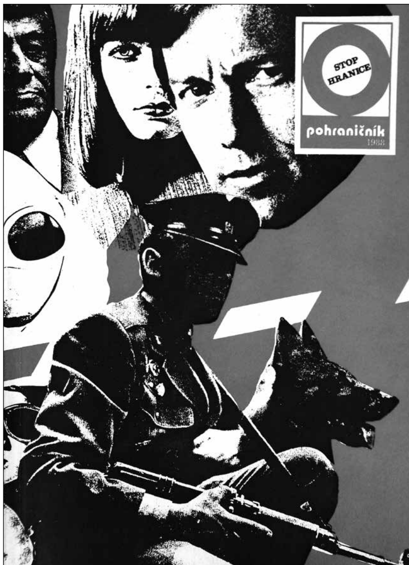
Titulní strana magazínu Stop hranice , vycházejícího jako příloha časopisu Pohraničník – Stráž vlasti